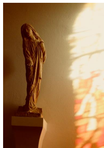
Socha umělce Fr. Bílka v našem sboru

Víme přece, že bude-li stan našeho pozemského života stržen, čeká nás příbytek u Boha, věčný dům v nebesích, který nebyl zbudován rukama.