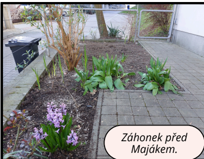
Záhonek před Majákem.

Koncem dubna jsme na společné schůzce pracovníků a obyvatel obou domů na půl cesty oslavili dvoje narozeniny obyvatel, probrali jsme, co se děje nového, co plánujeme do budoucna apod. Ocenili jsme také obyvatele, kteří se zapojili do dubnové potravinové sbírky a vydatně tak pomohli celou akci úspěšně zvládnout.