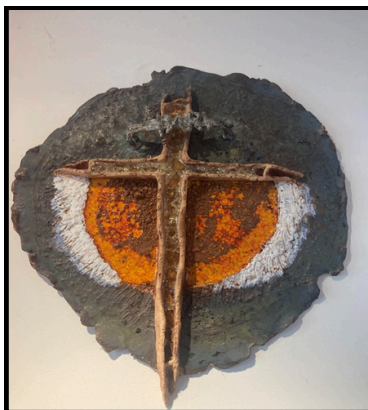
Dílo od výtvarníka Miloše Šedivého z Tlučně u Litoměřic.