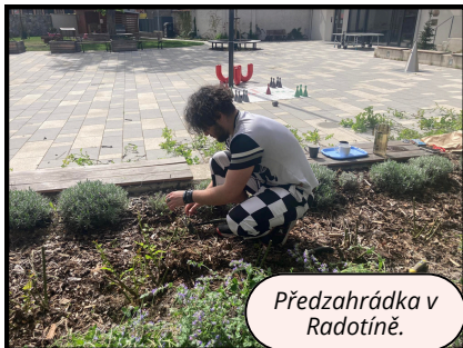
Předzahrádka v Radotíně.

V dubnu jsme v Majáku a v Koruně vyhlásili velký jarní úklid, do kterého se zapojili všichni obyvatelé i pracovníci. Obyvatelé si pořádně uklidili své byty, pracovníci dělali větší úklid kanceláře a všichni jsme se pustili do společných prostorů. Také jsme postupně upravili předzahrádku u Majáku, farní zahradu sboru v Michli a také záhonky ve dvoře v Koruně v Radotíně, o které jsme se zavázali pravidelně starat.